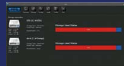
ストレージ管理モジュール画面

ストレージ管理モジュールは、保存先ディスク (RAID) の空き容量を管理・コントロールするプログラムです。最大保存容量を設定し、設定した値で複数のドライブを切り替えてご使用になれます。また、ディスク (RAID) の増設を容易とします。